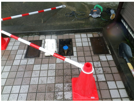
給水管破損部確認