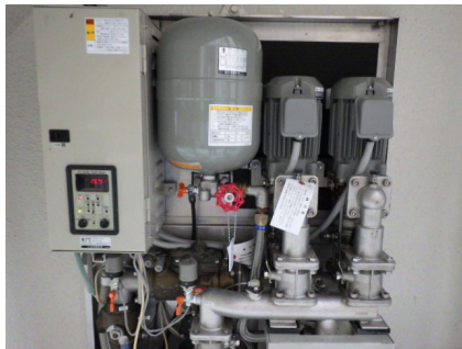
増 圧 ポ ン プ