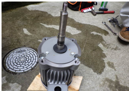
ポ ン プ 分 解